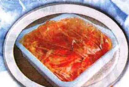
イカ入り白菜キムチ